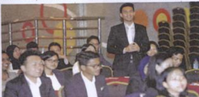
PERSIDANGAN akan memuatkan pelbagai perkongsian pengetahuan tentang keusahawanan sosial.