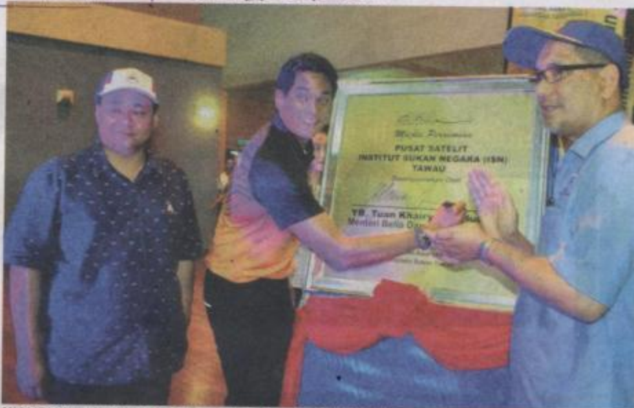
KHAIRY (tengah) ketika melancarkan Pusat Satelit ISN di Tawau, Sabah semalam.

"Saya tiada apa-apa komen. Keputusan Tunku Ismail telah dibuat dan semua pihak harus menghormatinya," kata Khairy pada sidang akhbar selepas merasmikan Majlis Pelancaran