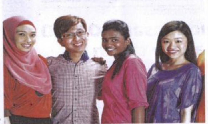
PROGRAM ICYL akan membuka minda para belia supaya berdaya saing di samping menengahkan keusahawanan sosial. - GAMBAR HASRAN.

Bagi belia yang berminat menyertai ICYL atau ingin mendapatkan maklumat lanjut boleh melayari laman web www.icyl.com.my atau berinteraksi menerusi laman sosial facebook ICYL. Segala maklumat dan informasi berhubung persidangan tersebut telah dimuatkan ke dalam portal berkenaan.