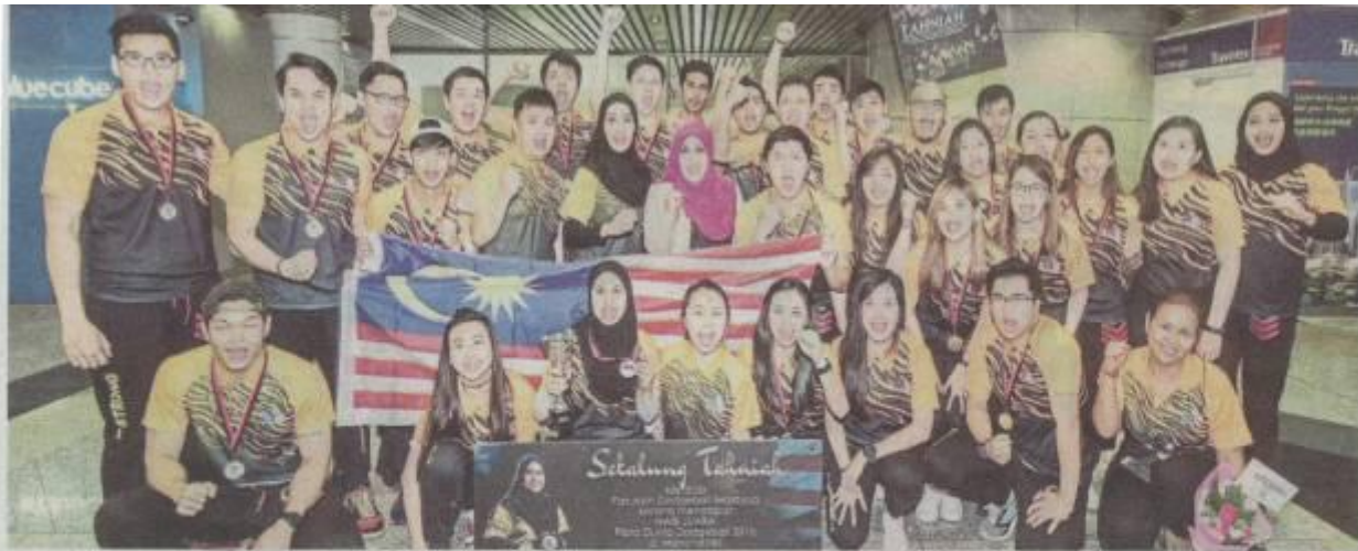
Pasukan dodgeball negara muncul naib juara pada kejohanan Piala Dunia Dodgeball di Manchester, April lalu.