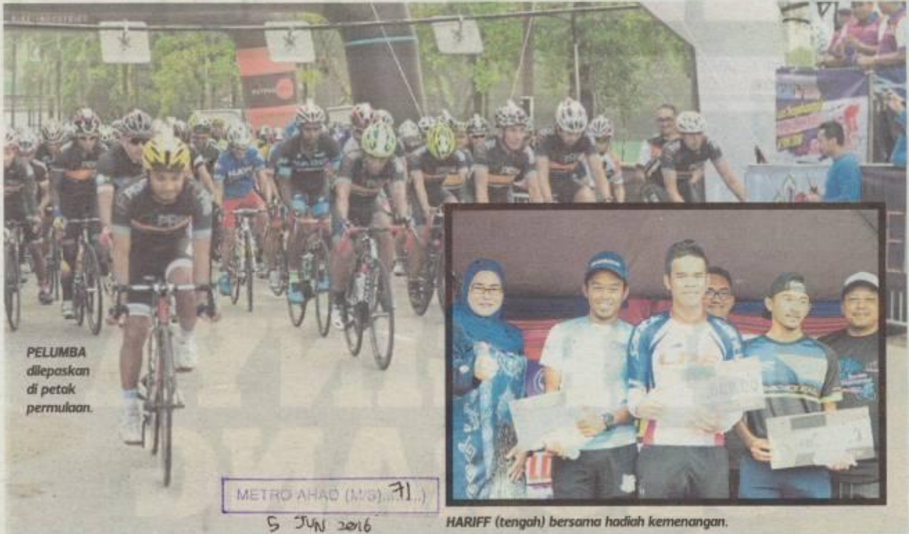
PELUMBA dilepaskan di petak permulaan.

■ Hariff sasar konsisten setiap kejohanan sebelum Sukan SEA