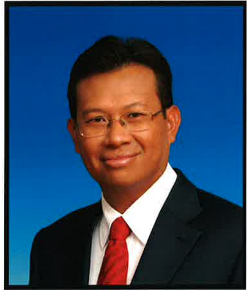
YB DATO' SRI AHMAD SHABERY CHEEK MENTERI BELIA DAN SUKAN

“Sukan merupakan satu bidang yang dapat memberi pelbagai sumbangan terutama kepada peningkatan tahap kesihatan, perpaduan dan integrasi nasional di samping pemupukan semangat patriotik, pembentukan masyarakat berdisiplin dan berdaya saing. Ketika tumpuan terarah kepada sasaran kutipan pingat dalam temasya sukan utama, matlamat membudayakan sukan di kalangan masyarakat juga tidak pernah diketepikan.