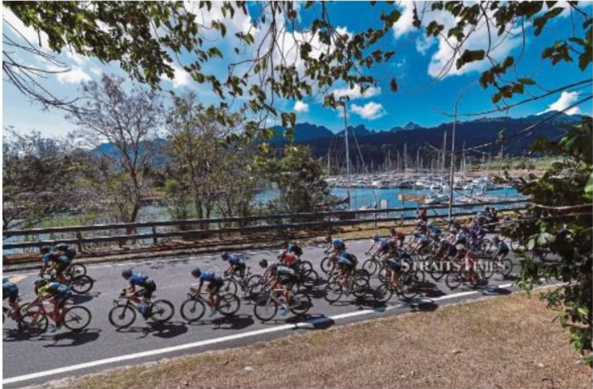
Le Tour de Langkawi has been an annual event since 1996 until last year's edition was cancelled due to Covid-19.