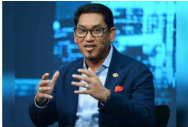
Datuk Seri Ahmad Faizal Azumu

KUALA LUMPUR - Menteri Belia dan Sukan Datuk Seri Ahmad Faizal Azumu berharap agar semua pihak dapat menghentikan polemik atau andaian negatif dalam isu berkaitan Persatuan Badminton Malaysia (BAM) dan Lee Zii Jia.