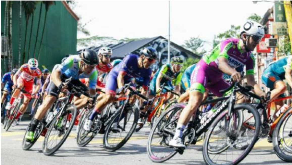
KBS sudah menjadualkan Mesyuarat Jawatankuasa Pelaksana LTdL 2022 pada Khamis ini.

Kuala Lumpur: Kejohanan Le Tour de Langkawi 2022 (LTdL 2022) yang sepatutnya berlangsung dari 3 hingga 10 Mac akan ditunda kepada 18 hingga 26 Jun depan.