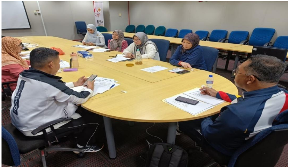
Mesyuarat AJK AKRAB KBS Bil. 1 / 2025

Mesyuarat dilaksanakan sebanyak 2 kali pada tahun 2025. Mesyuarat Jawatankuasa AKRAB KBS membincangkan program intervensi, isu-isu berbangkit dalam kalangan warga dan perancangan strategi dalam penglibatan AKRAB KBS dalam isu organisasi. Mesyuarat Jawatankuasa AKRAB Bil. 1/2025 diadakan secara fizikal di Bilik Mesyuarat Bahagian Pengurusan Sumber Manusia (BPSM), KBS pada 18 Februari 2025. Manakala Mesyuarat Jawatankuasa AKRAB Bil. 2/2025 dijalankan secara dalam talian pada 25 Julai 2025.